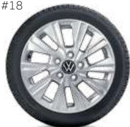
#18 VW Dundrod, silver за T7 Multivan