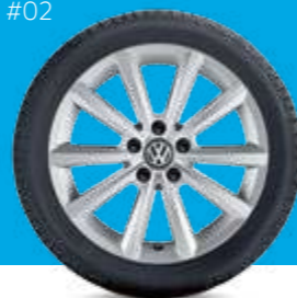
#02 VW Merano за Arteon