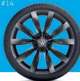
#14 VW Chennai за Arteon