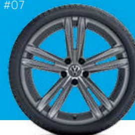
#07 VW Sebring, grey metallic 1) за Touareg